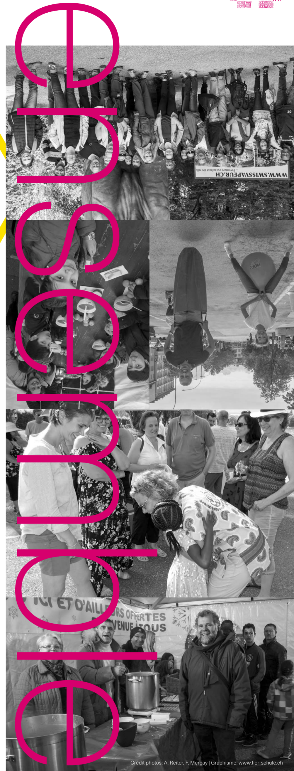
Graphisme: www.tier-schule.ch